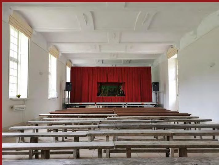
Chateau de Tilloloy ( Salle sans gradins avec scène surélevée 80 cm )