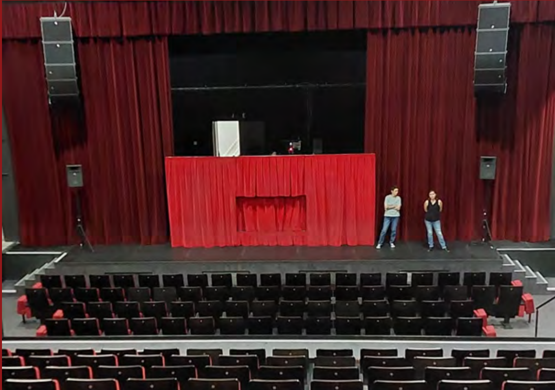
Entrepôt des Sels à St Valery sur Somme ( Salle avec gradins )